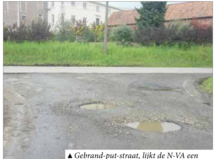
▲ Gebrand-put-straat, lijkt de N-VA een naam die beter overeenkomt met de realiteit.

De foto spreekt voor zich. Binnenkort worden de straatnaamborden veranderd. De Gebrand-put-straat is voor ons een vlag die de lading een stuk beter dekt.