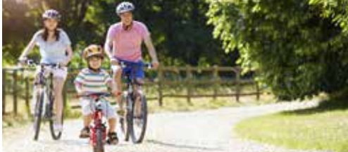
Vlaanderen investeert in Halense fietspaden p.2