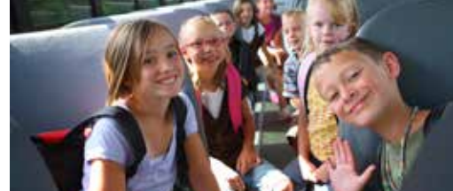
Schoolbus of soepbus? p.3