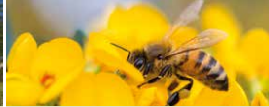
Wordt Halen 'bij-vriendelijk'? (p.3)