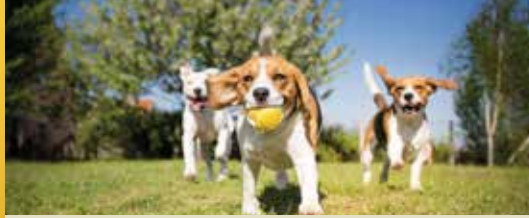
Geen hondenloopweides in Halen (p.2)